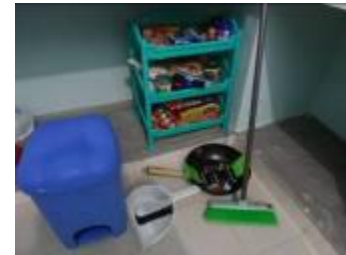
4) Trap in Guesthouse is betegeld!